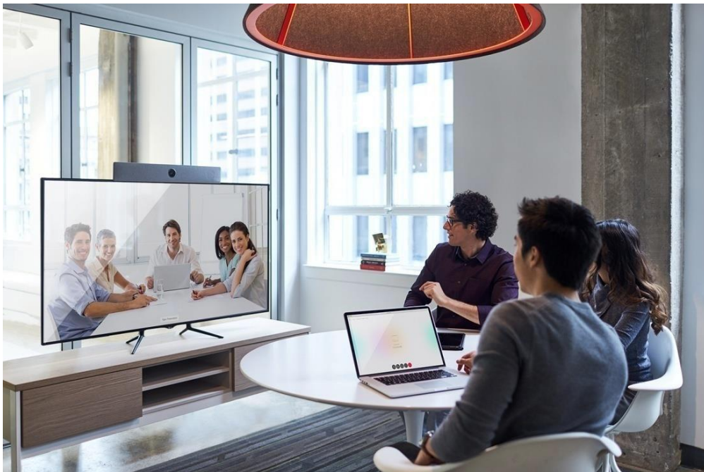
图 1. 小型会议室场景中的思科 Webex Room Kit

Room Kit将摄像机、编解码器、扬声器和麦克风集成到单个设备中，非常适合中小型会议室使用。它采用先进的摄像机技术，使小型会议室环境也能实现发言者跟踪（跟踪距离可至6米）。在保证丰富的功能和体验的同时，该产品在定价和设计上也经过仔细考量，可确保轻松扩展到您的所有中小型会议室和空间，无论您是选择本地注册还是通过思科协作云注册到思科 Webex，都能获得这些优势。