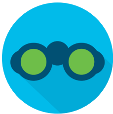
资产可视性和合规性 快速威胁