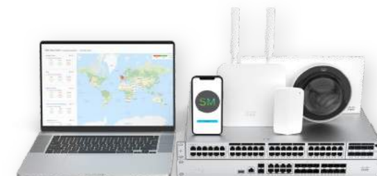
Meraki Systems Manager 모바일 기기 관리