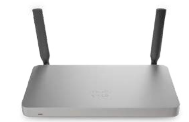
Meraki MX 보안 및 SD-WAN 어플라이언스 (본사)