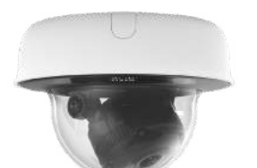
Meraki MV 카메라