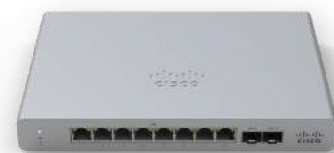
Meraki MS 스위치