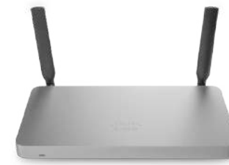
Meraki MX 보안 및 SD-WAN 어플라이언스 (본사)