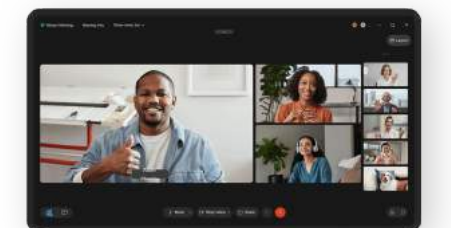
협업용 Webex Go