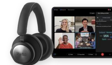
노이즈 캔슬링 및 배경 오디오 제거를 위한 Cisco 헤드셋과 Webex