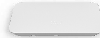
Meraki MR 무선 액세스 포인트