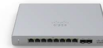
Meraki MS 스위치