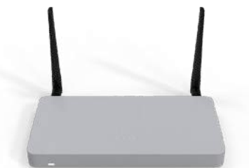
Meraki MX 보안 및 SD-WAN 어플라이언스