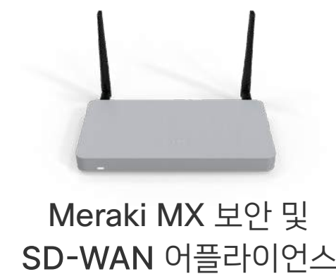
Meraki MX 보안 및 SD-WAN 어플라이언스