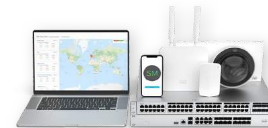
Meraki Systems Manager 모바일 기기 관리