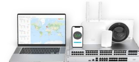
Meraki Systems Manager 모바일 기기 관리