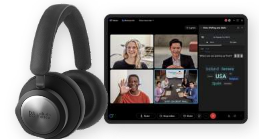
협업용 Webex와 Cisco 헤드셋