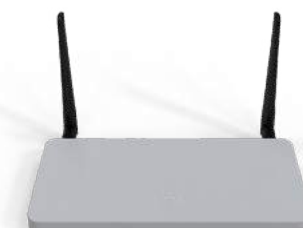
Meraki MX 보안 및 SD-WAN 어플라이언스