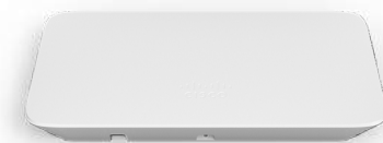
Meraki MR 무선 액세스 포인트