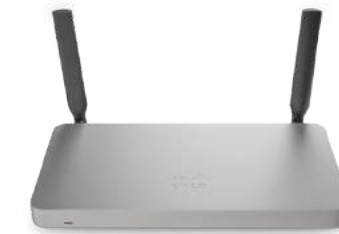
Meraki MX 보안 및 SD-WAN 어플라이언스