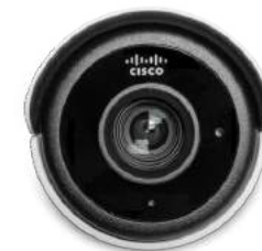
Meraki MV 카메라