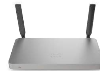
Meraki MX 보안 및 SD-WAN 어플라이언스 (본사)