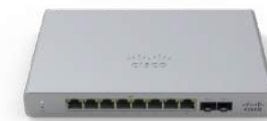
Meraki MS 스위치