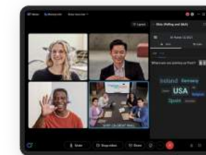
협업과 보안을 위한 Webex