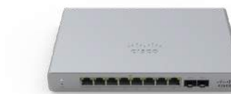
Meraki MS 스위치