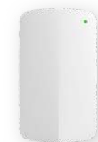
Meraki MT 센서