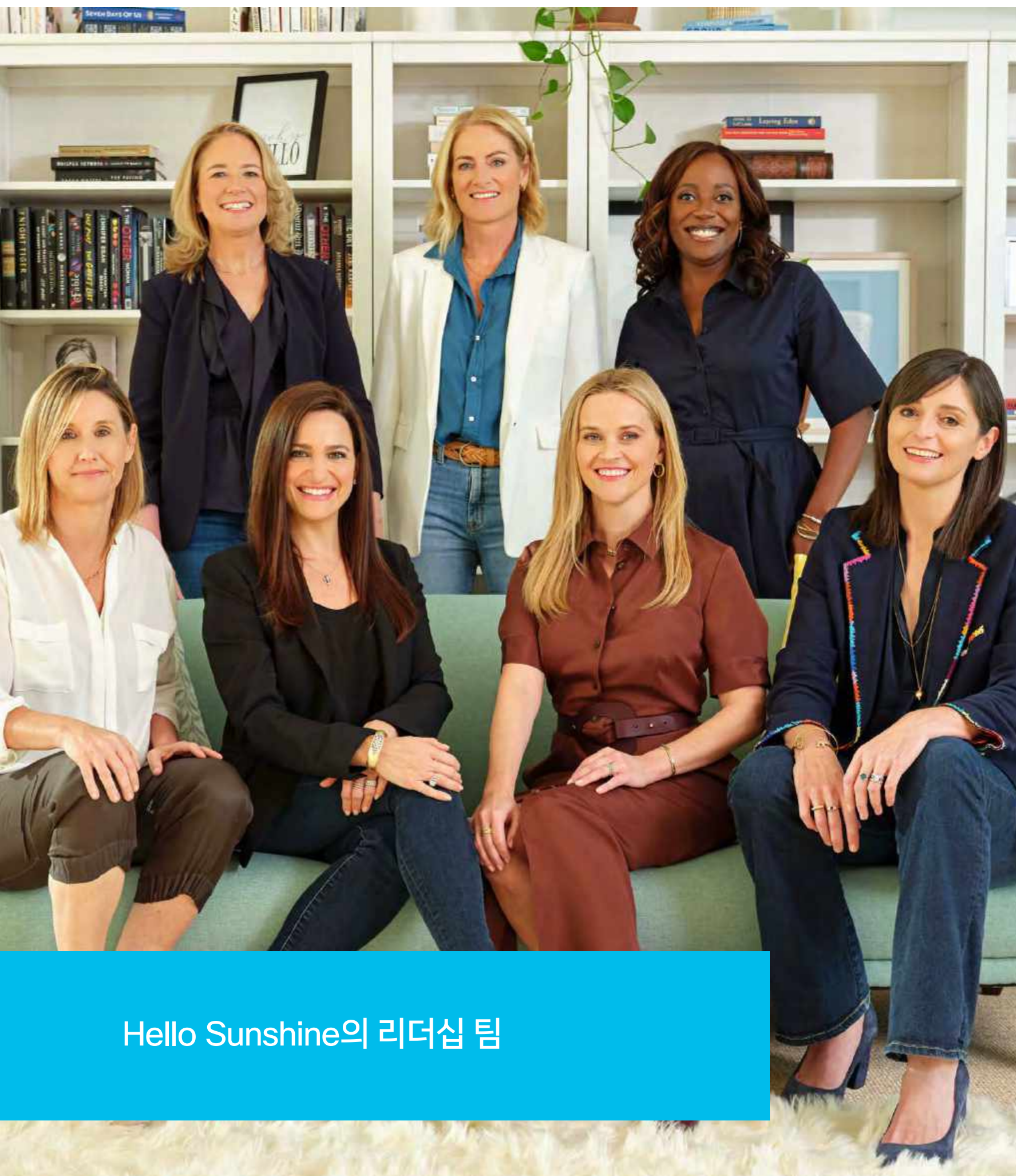
Hello Sunshine의 리더십 팀

미국 배우 겸 제작자인 Reese Witherspoon은 2016년 자신의 미디어 기업인 Hello Sunshine을 설립할 당시에 전통적으로 남성 위주의 산업에서 여성의 존재감과 스토리텔링을 늘리겠다는 커다란 비전을 가지고 있었습니다.